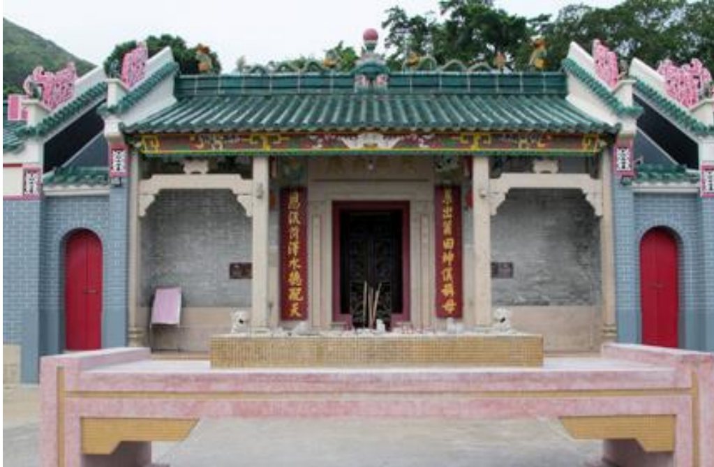
西貢佛堂門天后廟 俗稱大廟